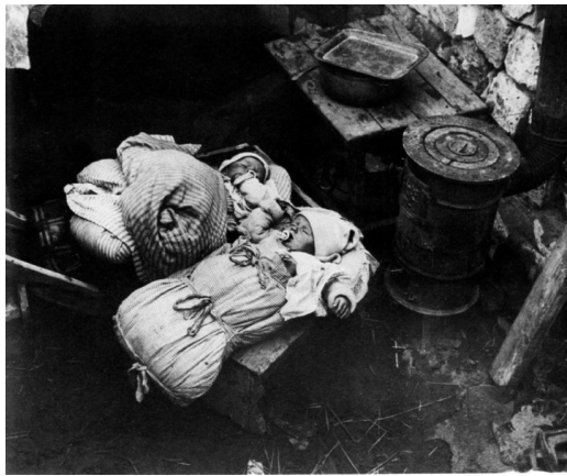
Ikercecsemők a Hangyatelepen