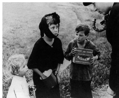
Gyerekek a pesterzsébeti nyomortelepen