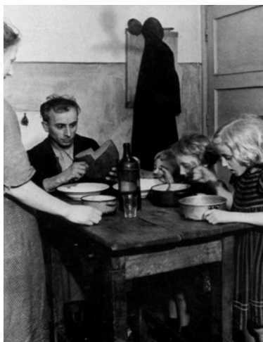
Ötgyermekes óbudai munkás- család