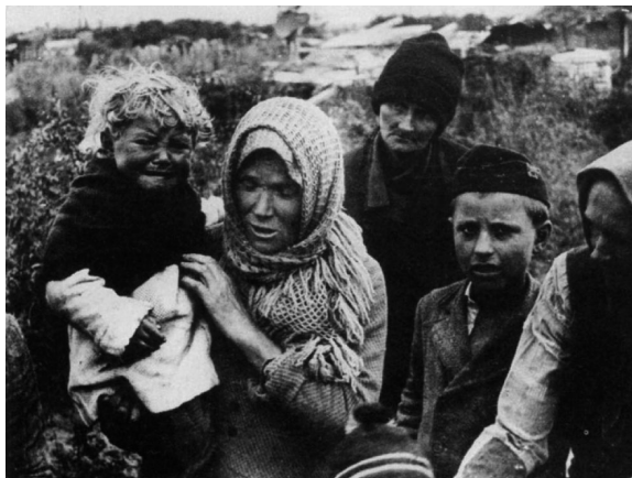
Kilakoltatottak a szabad ég alatt