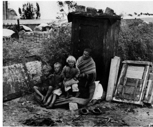
Anyja gyermekeivel a Hangyatelepen