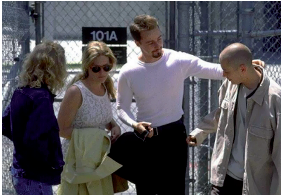
5. Szabadulás a börtönből