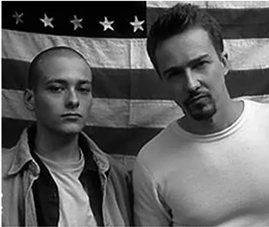
Edward Furlong and Edward Norton in "American History X."