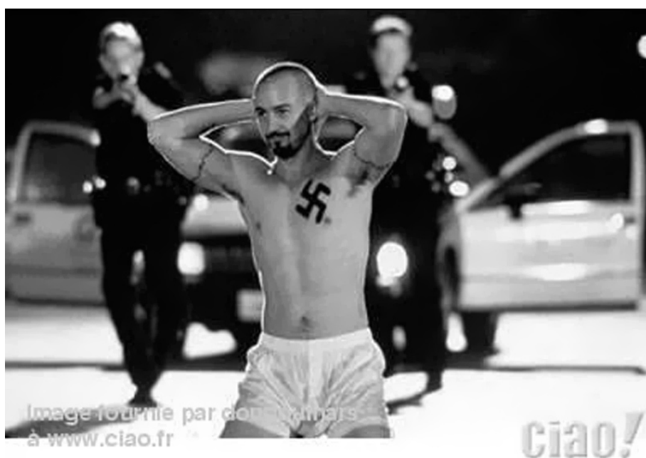
4. A „hőstett” után