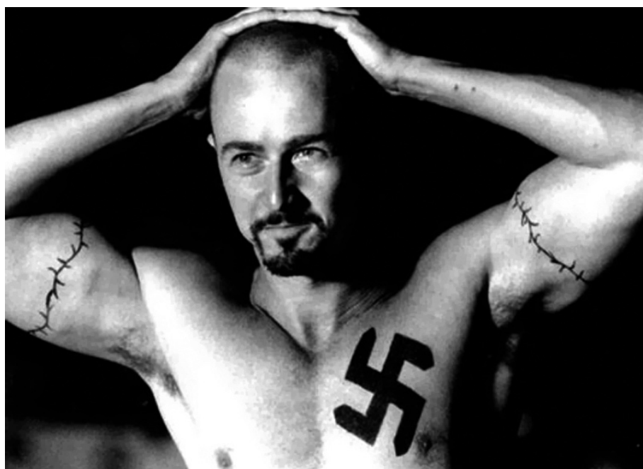
3. A büszke náci