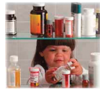
4. Nem szabad! Kisgyerek a gyógyszeres szekrény előtt