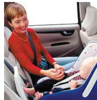
3. Gyerekülés az autóban