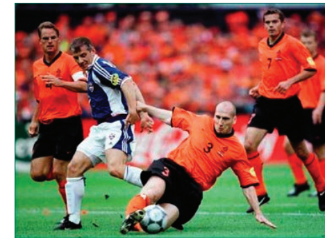
2. Sportszabályok (szabálytalankodó focisták)