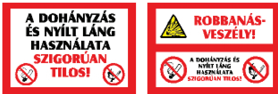
5. Tiltó tábla 1., 2 (Figyelmeztetés robbanásveszélyre)