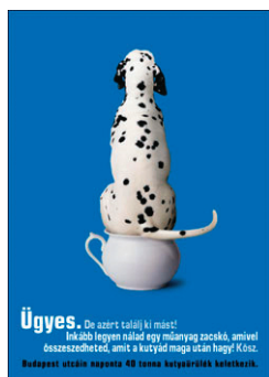
6. A kutyapiszok eltakarítására való figyelmeztetés (Egy kutya ül a bilin – nem ez a megoldás)