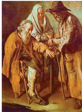
1. Három koldus (Giacomo Ceruti [Pitocchetto] festménye, 1736)