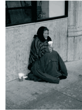
6. Kolduló kisfiú