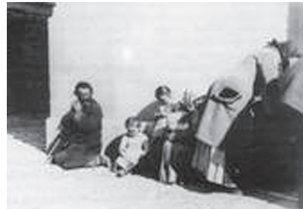
2. Kolduscsalád századunk elején. Koldusok a pesti utcán