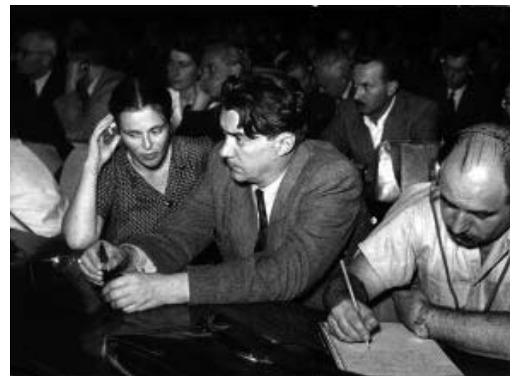
10. Helyszíni közvetítés