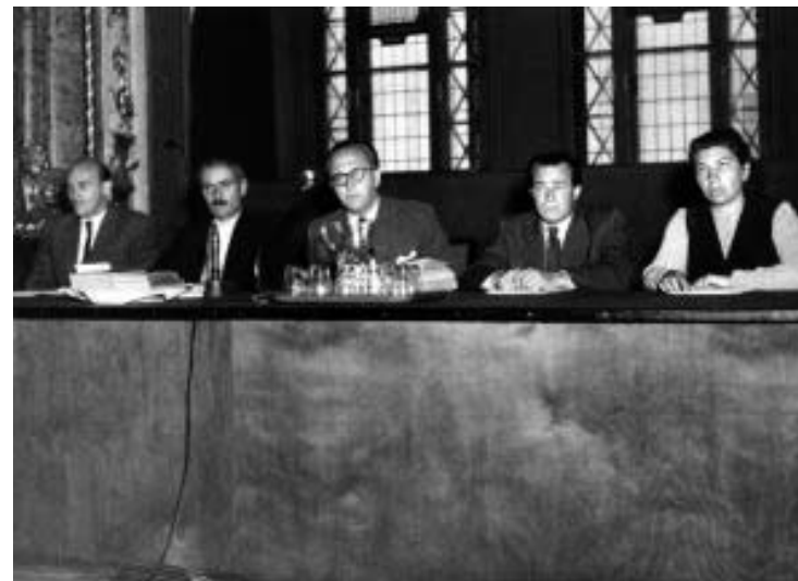
8. A bíróság