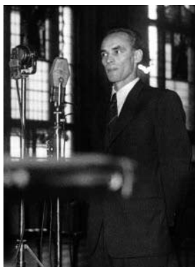
9. Rajk a bíróság előtt