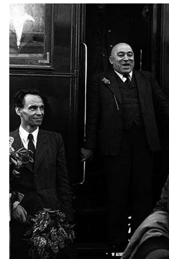
3. Rákosi és Rajk