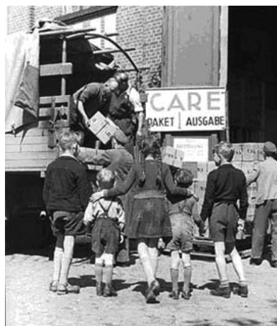
06 A Marshall-segély (élelem)