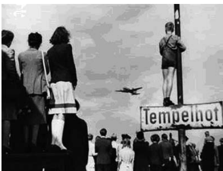
11 Berliniek figyelik a repülők érkezését. Előtérben a reptértábla.