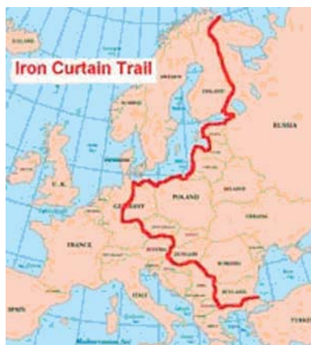
05 A vasfüggöny