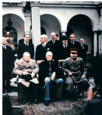
03 A jaltai „nagyok”