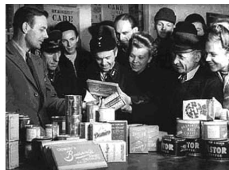
13 Megérkezett az élelemszállítmány a berlini üzletbe. (Jelentős részben por formában)