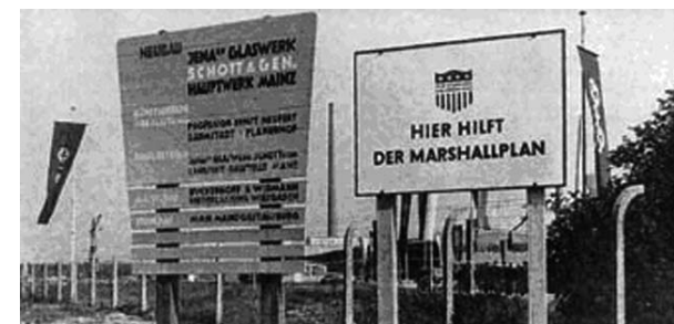
07 A Marshall-segély (munka)