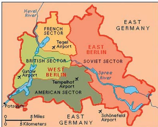
02 Berlin megszállási övezetei