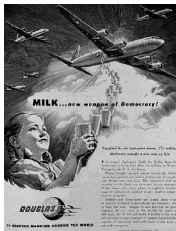
12 Német propagandaplakát a segélyszállításokról.