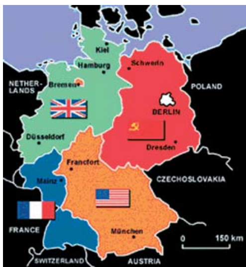
15 Németország megszállási övezetei