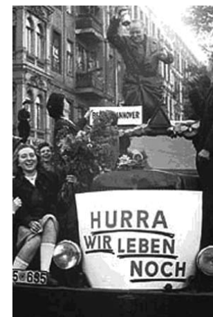
14 Öröm az utcán