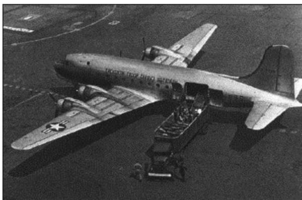
09 C-47-es típusú szállítógép. Ilyen gépekkel oldották meg a nyersanyagszállítást Berlinbe a légihídon.