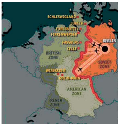
08 A légihíd