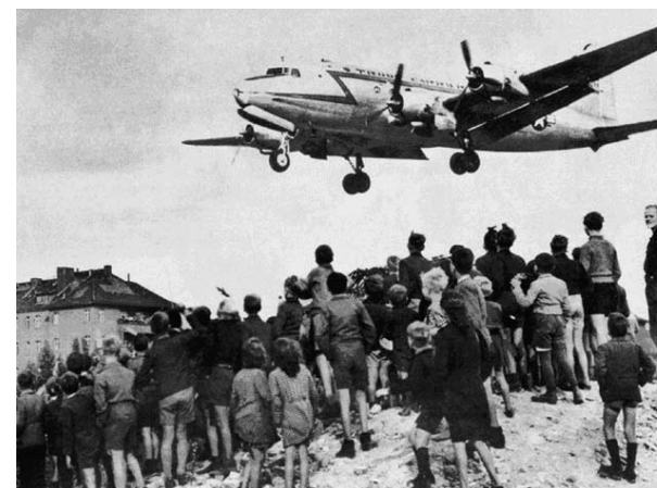
10 Berliniek figyelik a repülők érkezését.