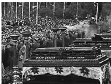
Rajk Lászlóék újratemetése