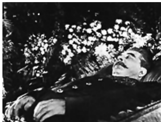
Sztálin a ravatalon