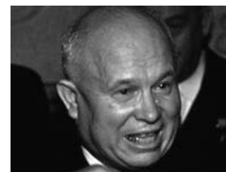
Nyikita Szergejevics Hruscsov